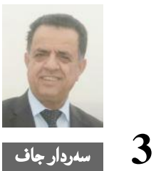
3 سه‌ر دار جاف

کێرکێرانی کوردستان ده‌ره‌به‌ری که‌ مه‌به‌ستی به‌رته‌سکردنه‌وه‌ی ناگه‌رکه‌یه‌ له‌ ده‌رویه‌ری سووریا و لایه‌یه‌کان و بینه‌ساقای دابه‌شبوونی خاکه‌یه‌کان به‌ ده‌گرتیه‌وه‌، سه‌ره‌تا به‌ بڕویه‌نووی هه‌بوونی ده‌ستی ویلایه‌ته‌ یه‌که‌گرتوه‌کانی ئه‌مه‌ریکا له‌ کوده‌تاکه‌ی مانگی ته‌موزی سالی رابردوو و دانه‌دان و ده‌ست له‌ پشستدان و پشتگیریکردنی بزوته‌وه‌که‌ی فەخووللا گوێله‌ن، هێدی هێدی روه‌ی ئه‌م ولاته‌ به‌ره‌و بلۆکی رۆژه‌لات و ده‌رچه‌خا، له‌ بینه‌رتیه‌شدا مه‌به‌ست ئه‌و بزوته‌وه‌ نه‌یاری ده‌وله‌تی تورکیا نه‌بوو، وه‌لی ئامانجه‌که‌ ئه‌و گه‌مه‌ قورسه‌یه‌ که‌وا ده‌ده‌که‌وتیت نزیک بوویته‌وه‌، ته‌واو پشتقایی خۆی له‌ روه‌ی سه‌ربازی و ئابورییه‌وه‌ بۆ روسیا راگه‌یاند، هه‌ر کێرکی موشه‌کی دوور مه‌ودا تا به‌ غازی روسی ده‌کات، ئیتمه‌ وای کرد پشت نه‌ستور بیه‌ت به‌ ولاتی روسیا، لێره‌دا ئه‌وه‌ ده‌ده‌که‌وتیت که‌ روسیا له‌ سه‌رویه‌ندی خسته‌خواره‌وه‌ی فرۆکه‌یه‌ی له‌ لایه‌ن تورکیاوه‌، لایه‌نی دووم به‌ ئاشکرا پشتگیرییه‌کی خۆی بۆ شه‌رفانان و گه‌ریلاکانی سه‌ر به‌ پارتی